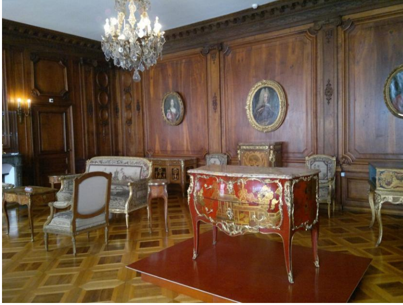
الاثاث في صالة في المتحف التاريخي