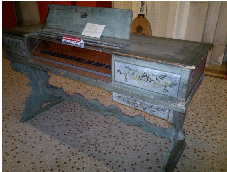
آلة موسيقية في صالة الموسيقى في المتحف التاريخي

قسم اللوحات والتماثيل : تعد من اهم ثلاث معارض مهمة في سويسرا. والمجموعة تعكس الاكتساح الرئيسي للفن الغربي من القرن الخامس عشر ولغاية يومنا ،والمكانة المهمة التي يحتلها الفنانون الايطاليون والفرنسيون والفلانغ والمدرسة الهولندية للقرون 17،18 وكما للانكليز للقرون 18.