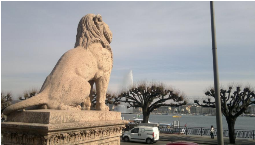
منظر من جنيف