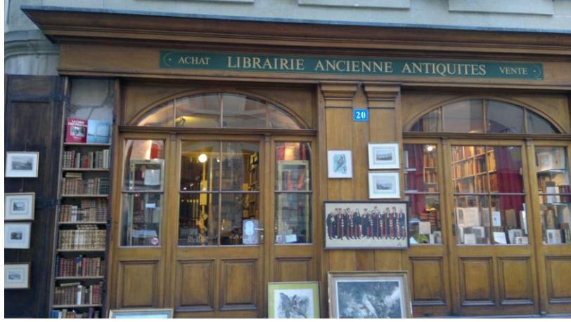
احدى مكتبات جنيف التاريخية

في قلب المدينة حيث تكثر المقاهي الشعبية ويلتم شمل الادباء والمثقفين والفنانين ،وكأني في شرقنا ،وكذلك فيها يمكن التعرف على النشاطات الفنية والثقافية في المدينة ونقطة التقاء المحبين للأدب والفن.