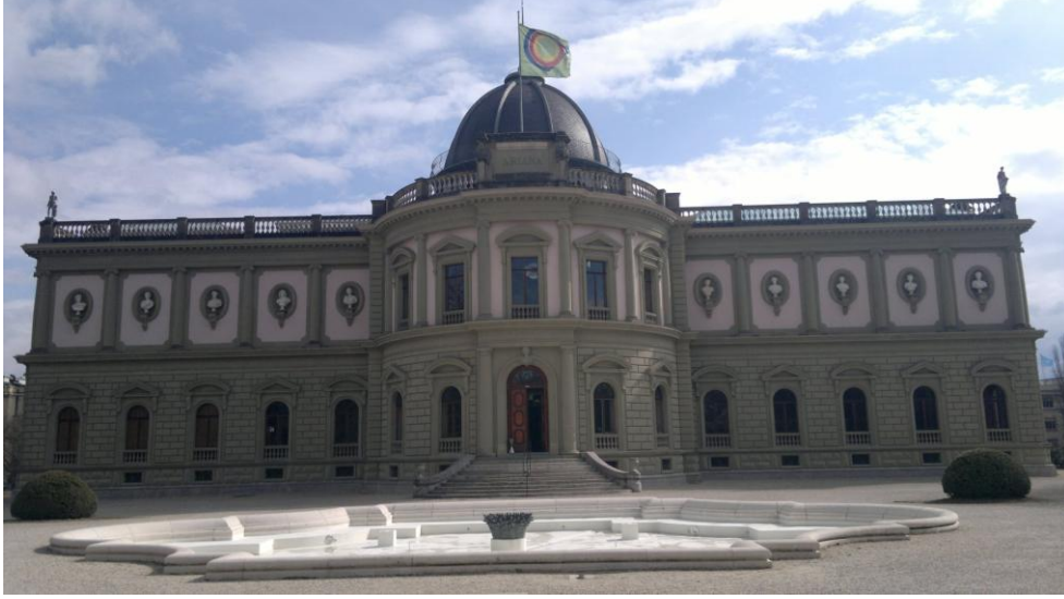
متحف آريانا ..تحفة هندسية رائعة في جنيف