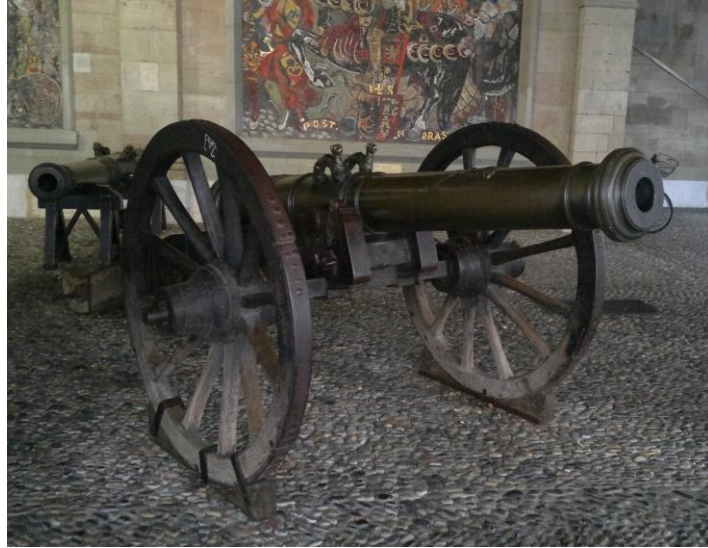
مدفع في المدينة القديمة

في قلب المدينة حيث تكثر المقاهي الشعبية ويلتم شمل الادباء والمثقفين والفنانين ،وكأني في شرقنا ،وكذلك فيها يمكن التعرف على النشاطات الفنية والثقافية في المدينة ونقطة التقاء المحبين للأدب والفن.