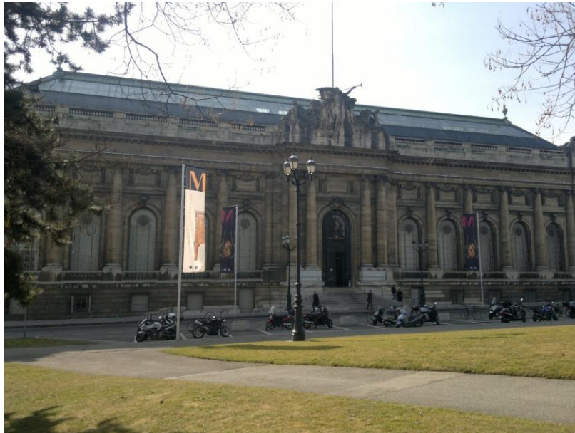
بنية المتحف التاريخي في جنيف