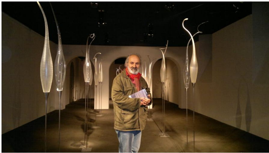
الكاتب في معرض الزجاج في متحف اريانا

قبل وصولنا الى القصر يطالعنا تمثال غاندي وحينها تفاجئ بوجوده في احدى الحدائق أمام بناية قديمة للغاية. فقد كان الزعيم الهندي من الزعماء الذين نالوا الشهرة الكبيرة في هذا الزمن، ولقد سمي ببطل المقاومة السلمية ضد الاستعمار. وأتذكر بان اول كتاب اشتريته في حياتي كان حول غاندي. والغرب يحاول دائما ان يصدر ثورته السلمية الى الشرق ولتعليم الشرق بأن الحرية والديمقراطية تأتيان ايضا من السلم. استمتعت بالتمثال ووقتها قلت مع نفسي باني جئت الى مدينة التماثيل. ولهذا كان النحات الكوردي (حميد كه مه كي) موضوع حديثنا بين الاصدقاء كلما تحدثنا عن التماثيل. والفنان حميد رجع بصورة نهائية الى دهبوك في كوردستان العراق ولم يبق من يحدثنا عن تماثيل جنيف!!