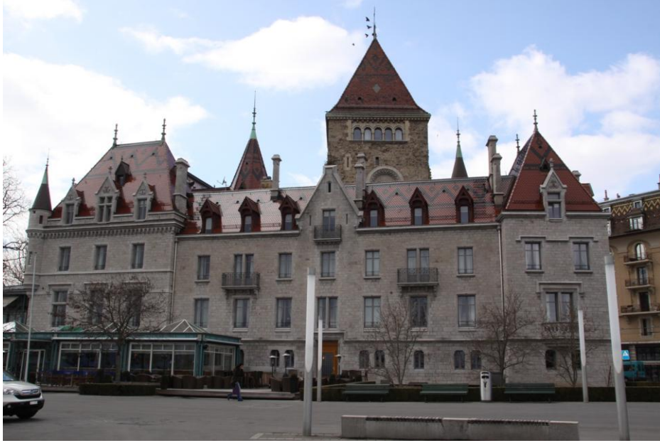
قصر اوشي المشووم في لوزان