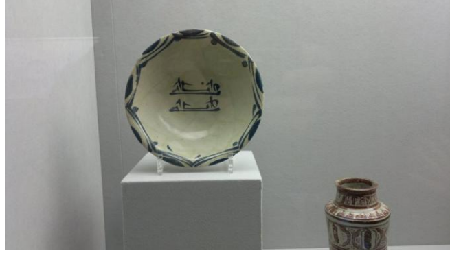
نماذج فن الخزف في المعرض في متحف اريانا