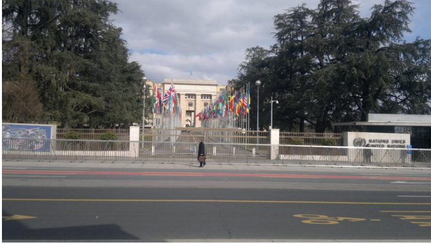
قصر الامم المتحدة في جنيف

في الطريق الى قصر الامم المتحدة وأمام احد ابوابها الرئيسية وفي ساحة كبيرة، يبرز بصورة واضحة هيكل ضخم لكرسي بثلاث ارجل والرجل الرابعة مكسورة، والزوار يصورونه بقطاعات مختلفة.