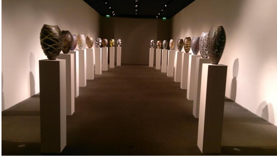
جانب من معرض الزجاج في المتحف

ولكن صالة جزيرة مورانو كانت تحفة وبقاوة من اجمل اعمال السيراميك والزجاج. أما الصين فهي حاضرة دائماً سواء في الامم المتحدة برفضها للقرارات، او في صالات الفن بزخرفات قصص الحب الصيني وملاحم البلاد وبطولات الثوار ... لحظات جميلة في متحف السيراميك قبل ان اتوجه الى قصر الامم المتحدة. حدقت في الاعلام المرفرفة وانتابنتي مسحات حزن لم لا ارى راية بلاد الكورد ترفرف عاليا بين رايات الامم والحزن يغزوني... وتباً للوزان وقصر اوشي وعام 1923 ... وتستمر الرحلة.