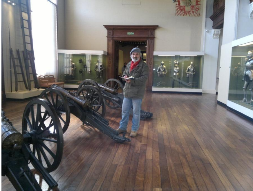
الكاتب في صالة الالات الحربية في المتحف التاريخي في جنيف

وفي احدى صالات الاثاث تبرز مدى التقنية الفنية للحفر على الخشب. وجذب نظري منضدة ضخمة في احد اركان المتحف تعود لعام 1702 من المرمر ورسمت عليها صور الحيوانات، وفي الوسط لوحة طبيعية.