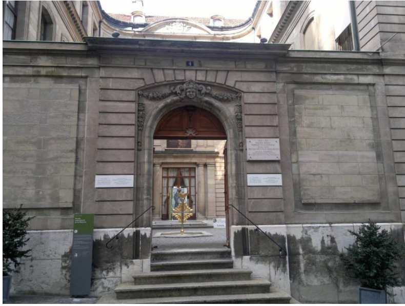
متحف الاصلاح الديني

وتعد هذه الكاتدرائية اول بناية مسيحية على تلة عالية في المدينة القديمة. وقد زارت هذه الكاتدرائية شخصيات عالمية مثلا عام 1988 كانت اول زيارة للزعيم الروحي للثبت الدالاي لاما لها، وكذلك زارها كوفي عنان الامين العام السابق للأمم المتحدة، وكذلك راهب دير شيناكاوا. وهذه البناية تعد من اقدم البنايات في جنيف وتدخل ضمن علم الاثار. وفي الداخل حيث اللوحات المرسومة على الحيطان والمرمر والصعود الى الابراج تفسح لمشاهدة بانوراما رائعة لمدينة جنيف. وقد تم تجديد البرج في القرن التاسع عشر، ويمكن مشاهدة المدينة كلها تقريبا. وفي البرج الشمالي يعلق الجرسان ويسمى (لاكليماس،لابيلريفي). لهذين الجرسين مكانة كبيرة وأهمية وذلك حيث جرس (لاكليماس) يدق فقط حين تكون الاحداث مهمة للوطن. ما بين الاعوام 1150-1230 اعدت الكنيسة على الاسلوب الغوتي والرومي ومنذ عام 1536 غدت الكاتدرائية اهم مكان للعبادة والقداسة في جنيف.