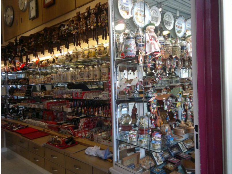
هدايا وتذكارات للزوار