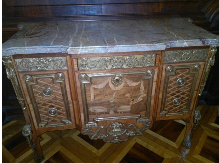
صندوق اثري في المتحف التاريخي

وفي احدى صالات الاثاث تبرز مدى التقنية الفنية للحفر على الخشب. وجذب نظري منضدة ضخمة في احد اركان المتحف تعود لعام 1702 من المرمر ورسمت عليها صور الحيوانات، وفي الوسط لوحة طبيعية.