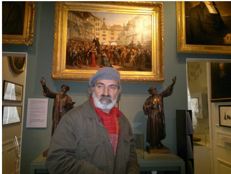
بدل رفو في متحف الاصلاح الديني