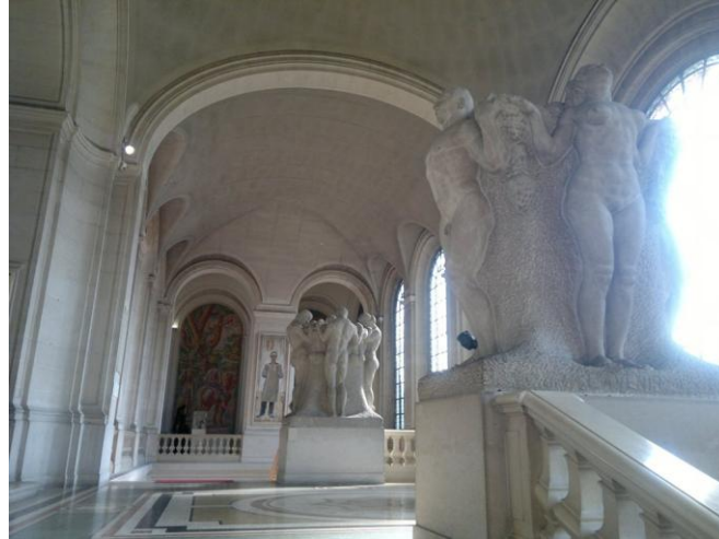
تماثيل ما بين الصالات في المتحف التاريخي

جزء من المجاميع هي قسم من التماثيل والفنون التطبيقية وجزء من الاثار. وهذا القسم يستخدم كمعرض دائم وتعد هذه الاعمال والتحف النادرة شهودا على الحضارة والثقافة الغربية من قبل التاريخ، قبل الكتابة لغاية يومنا هذا.