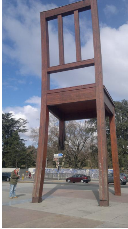
كرسي بثلاث ارجل