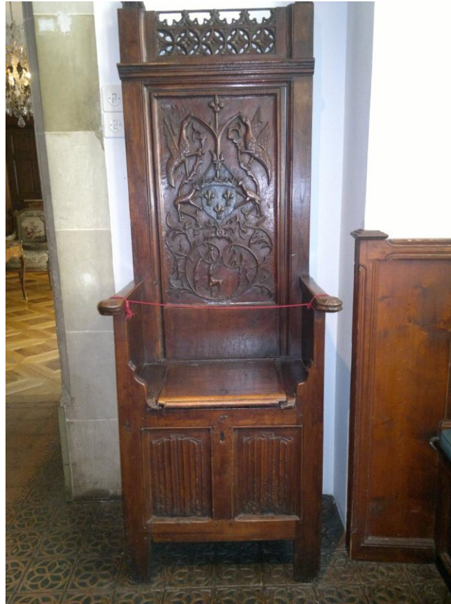
اثاث المتحف التاريخي