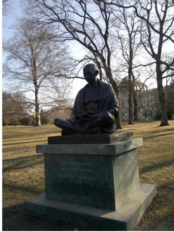
تمثال غاندي في جنيف

قبل وصولنا الى القصر يطالعنا تمثال غاندي وحينها تفاجئ بوجوده في احدى الحدائق أمام بناية قديمة للغاية. فقد كان الزعيم الهندي من الزعماء الذين نالوا الشهرة الكبيرة في هذا الزمن، ولقد سمي ببطل المقاومة السلمية ضد الاستعمار. وأتذكر بان اول كتاب اشتريته في حياتي كان حول غاندي. والغرب يحاول دائما ان يصدر ثورته السلمية الى الشرق ولتعليم الشرق بأن الحرية والديمقراطية تأتيان ايضا من السلم. استمتعت بالتمثال ووقتها قلت مع نفسي باني جئت الى مدينة التماثيل. ولهذا كان النحات الكوردي (حميد كه مه كي) موضوع حديثنا بين الاصدقاء كلما تحدثنا عن التماثيل. والفنان حميد رجع بصورة نهائية الى دهبوك في كوردستان العراق ولم يبق من يحدثنا عن تماثيل جنيف!!