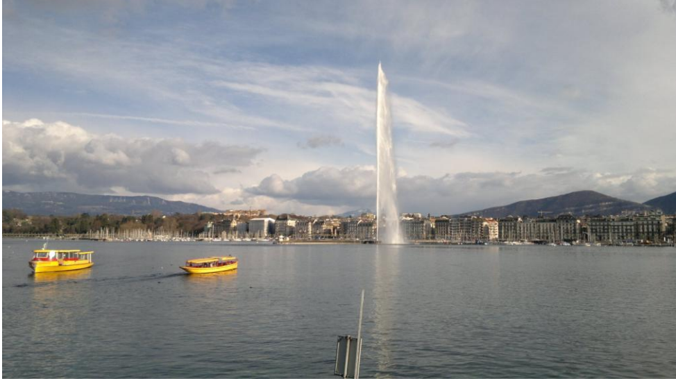
بحيرة جنيف ونافورتها الكبيرة

التنزه على شواطئ بحيرة ليمان بالفرنسية وكما تسمى بالألمانية بحيرة جنيف رحلة الى راحة البال والأمان.