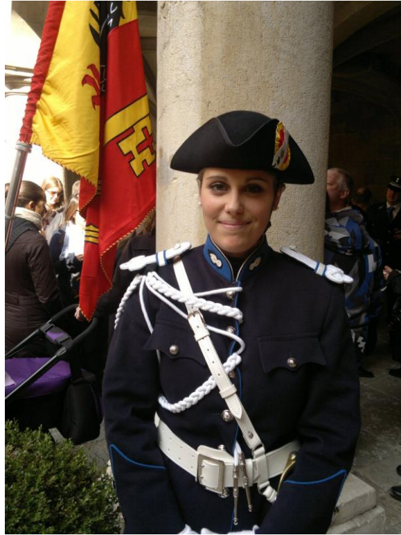
شرطية سويسرية احلى من الشوكولاته السويسرية

يصل القطار مدينة زيوريخ وأمامي 12 دقيقة فقط لتبديل القطار بقطار يتجه صوب جنيف. ركبت القطار وهذه المقاطعة حيث يتحدثون باللغة الالمانية والحمد لله لم الق صعوبة. انطلق القطار مسافة اقل من 3 ساعات بقليل وأنا استمتع ببحيرة زيوريخ والبنائيات والبيوت المطلة على البحيرة وانعكاسات شمس الصباح عليها لتولد لوحة رائعة من الألق والجمال. لم اشعر بارهاق المسافة ولا الناس حيث الناس مبتسمون وأنا بالي مشغول ما الذي ينتظرنني في اليوم الاخر في الامم المتحدة. تعودت دائما ان اكتب لقرائي ولمجلتي صوت الاخر مشاهداتي وانطباعاتي حول العالم وهل سأعود بجعبة فارغة من المشاهدات وأنا في هذه البلاد!!