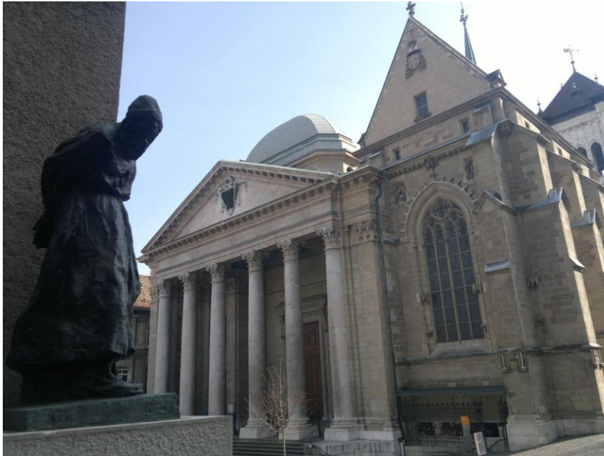
كاتدرائية بيري في المدينة القديمة

من بحيرة لي مان (جنيف) الى المدينة القديمة والأزقة الضيقة وفن العمارة الباهر والسلالم الحجرية لغاية وصولنا كاتدرائية بيري في قلب المدينة القديمة.