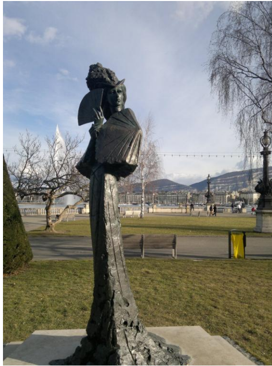
تمثال قيصره النمسا اليزابيث

والمشاهد يبصر نافورة من قلب البحيرة ترتفع 148 مترا، وكذلك كثرة السياح والحياة ودفقها.