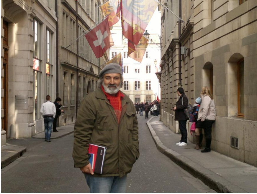
بدل رفو في المدينة القديمة

وفي قلب المدينة، وفي طريقي الى المتحف التاريخي في جنيف تبرز عالياً قبة صفراء وقد اخذت مكانة كبيرة في قلب المدينة.