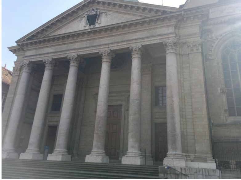
كاتدرائية بيري في المدينة القديمة

وكذلك تكثر التماثيل من الجهتين. أما الورود فهناك حركة دائمة من اجل الاعتناء بالرياض. وما لفت انتباهي اكثر من 10 عمال وهم يعملون في شجرة واحدة على الشارع العام بالقرب من البحيرة من اجل منظر المدينة. بحيرة لي مان رومانسية بحركتها وجمالها وانعكاس الجبل الابيض فيها يمنحها الالق والروح.