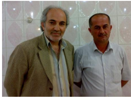
الشاعر : كرمانج هكاري