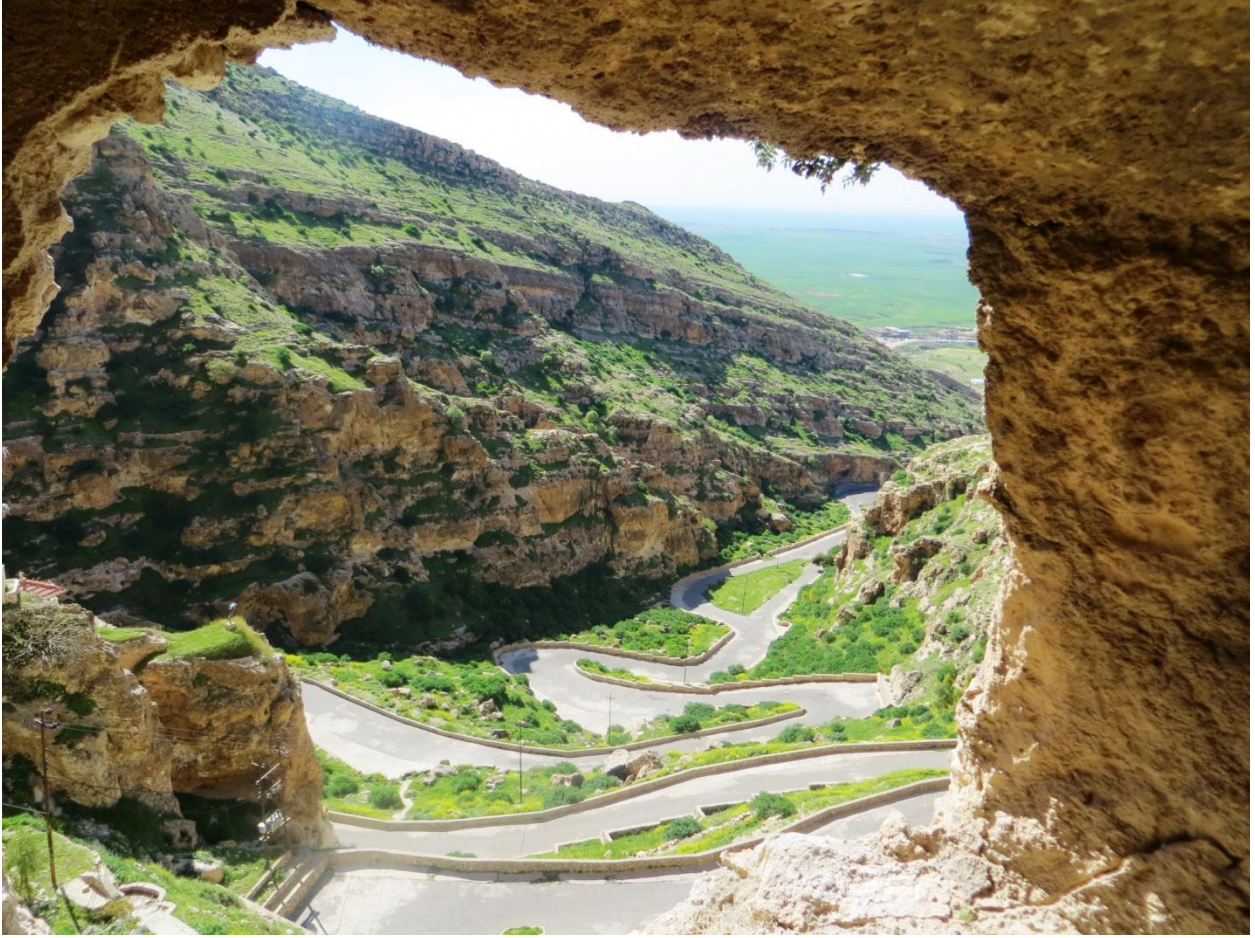
منظر من احدى قلايات دير الربان هرمزد