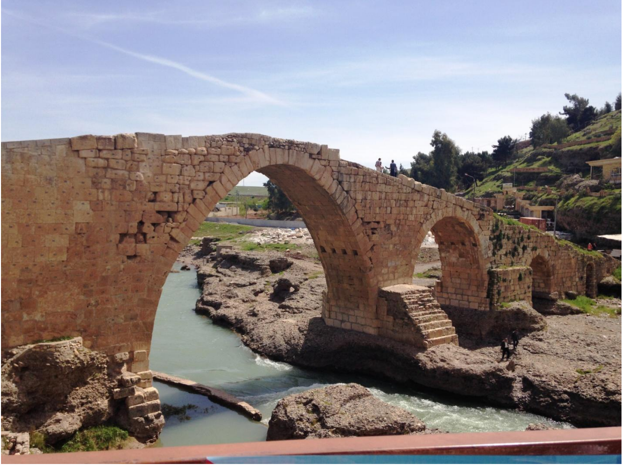
جسر الدلال في زاخو