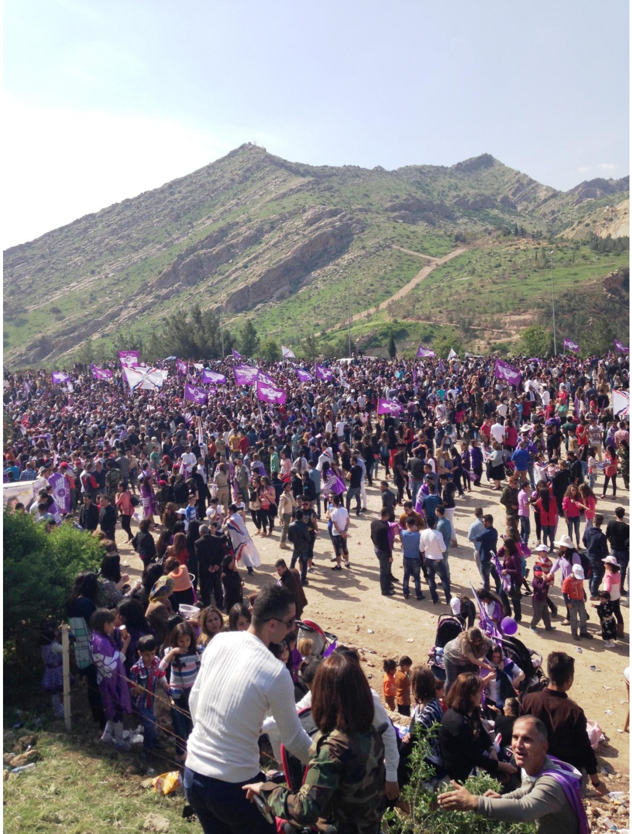
المسيرة البنفسجية في اكيثو بدهوك