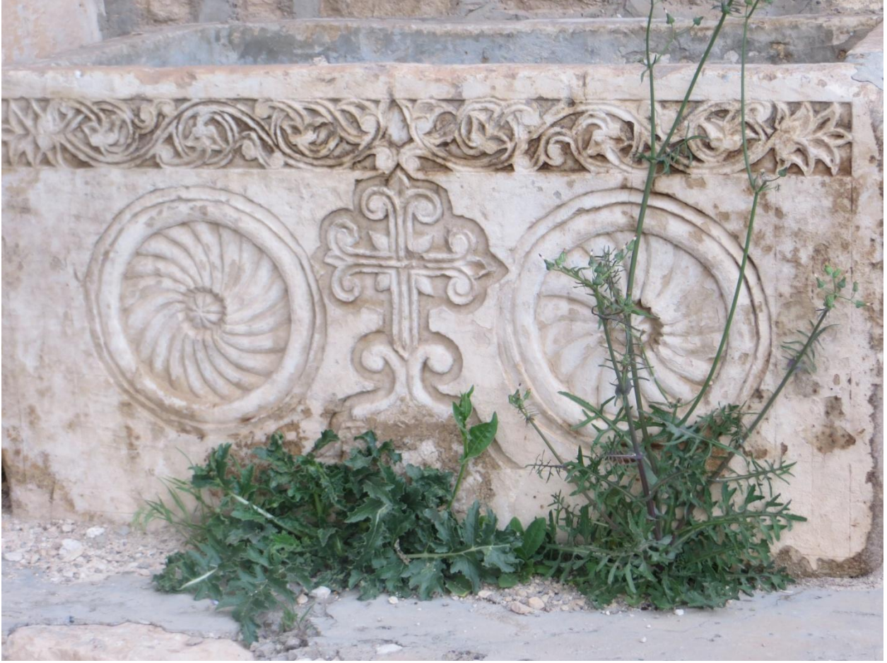
حوض حجري مزخرف في دير الريان هرمزد