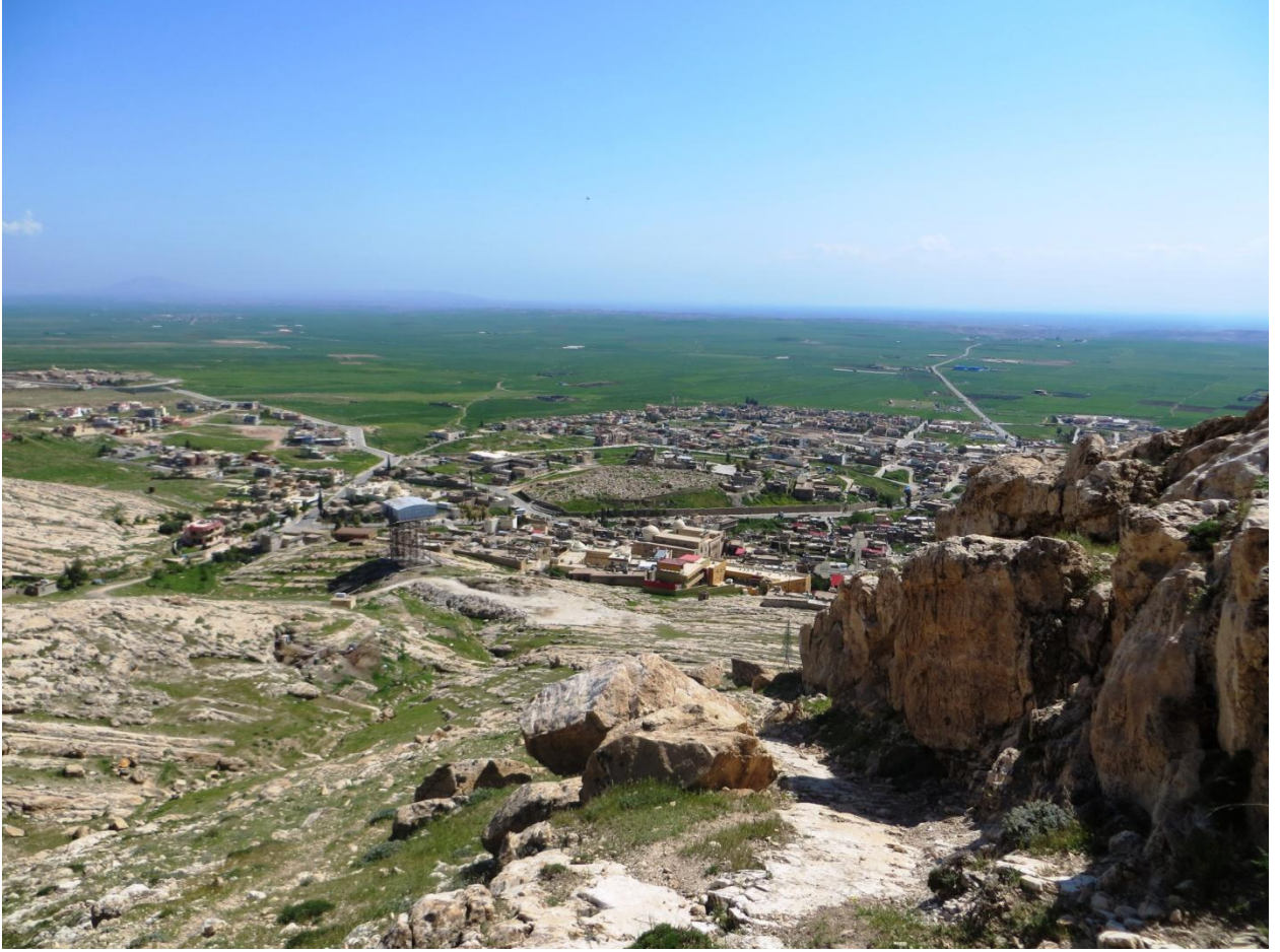
القوش من على الجبل