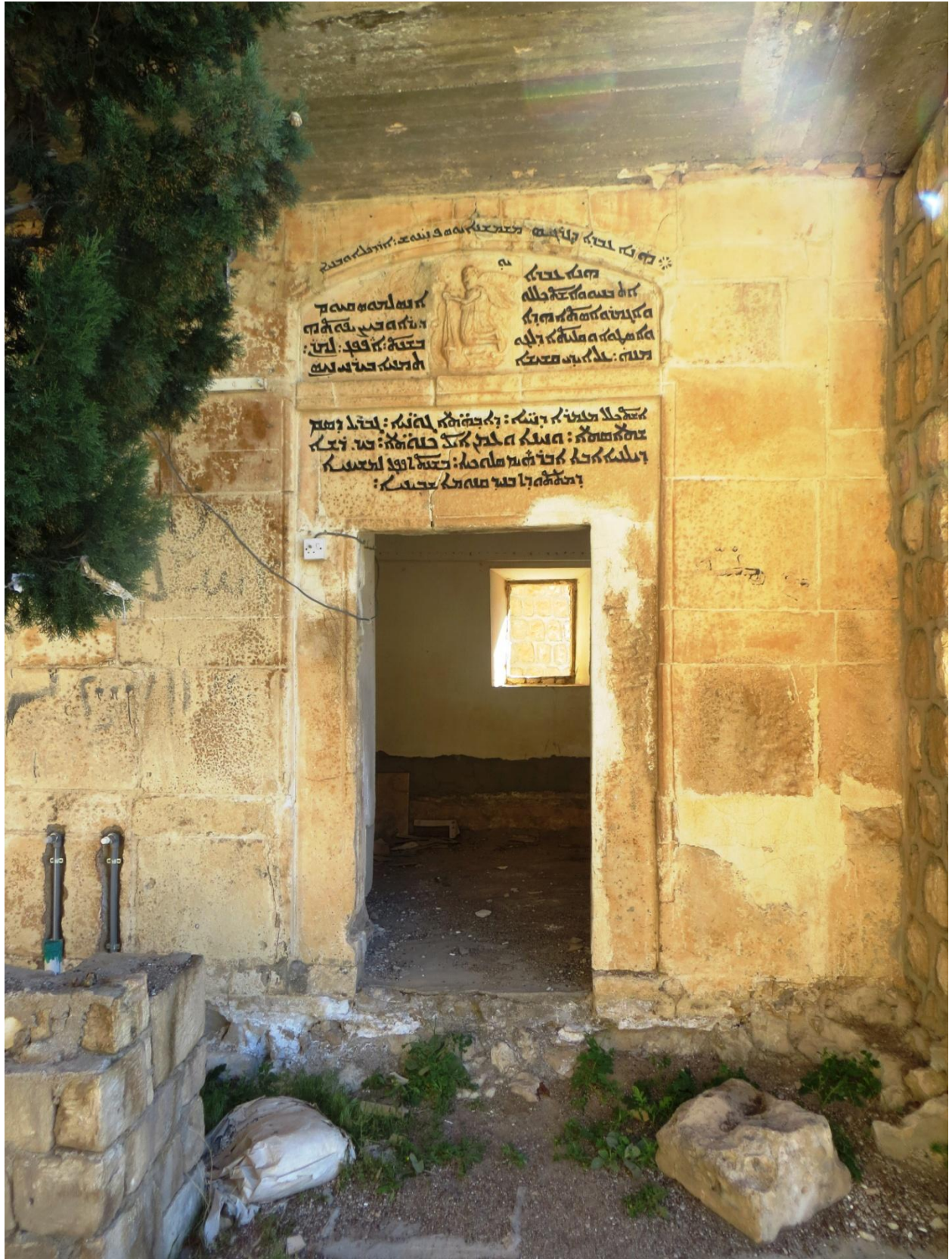
دير الريان هرمزد